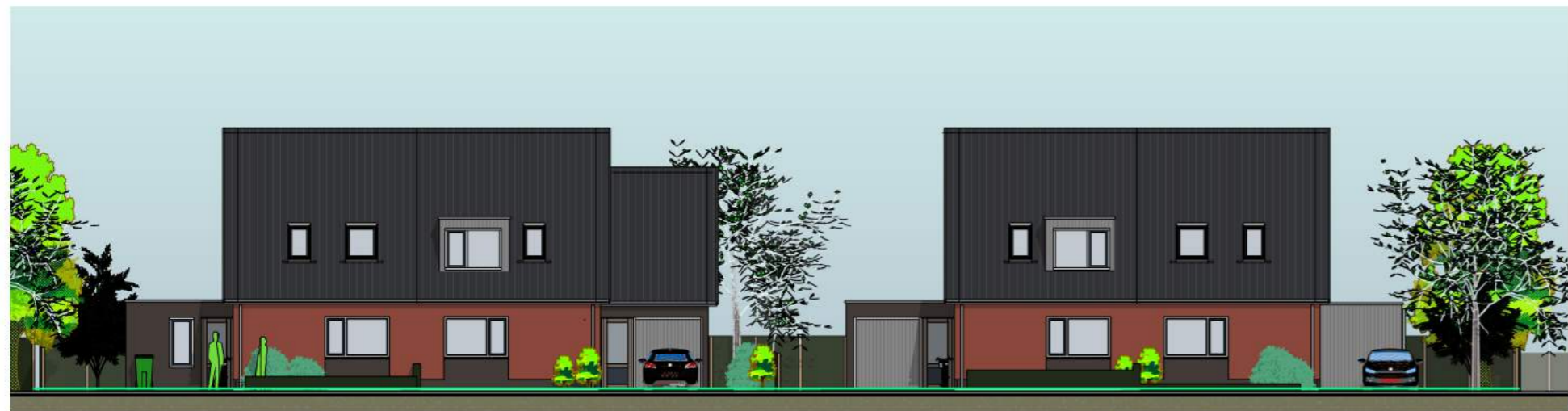
aanbouw mogelijkheid levensloop dakkapel en garage met kap aanbouw garage en dakkapel basiswoning met aanbouw berging voorgevel overzicht met suggestie diverse opties.