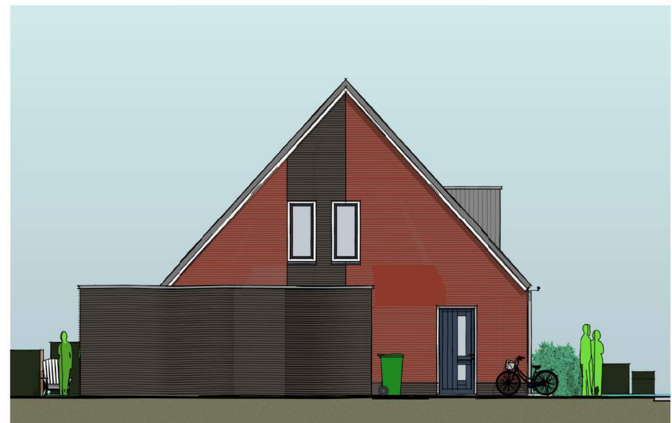
zijgevel, met optie garage/ levensloop

gegevens constructie opbouw en isolatie: - vloer: geïsoleerde prefabbetonvloer Rc=4,0 - gevel: houtskeletbouw Rc=4,5, baksteen afgewerkt - dak: prefab houtconstructie, geïsoleerd Rc=6,0