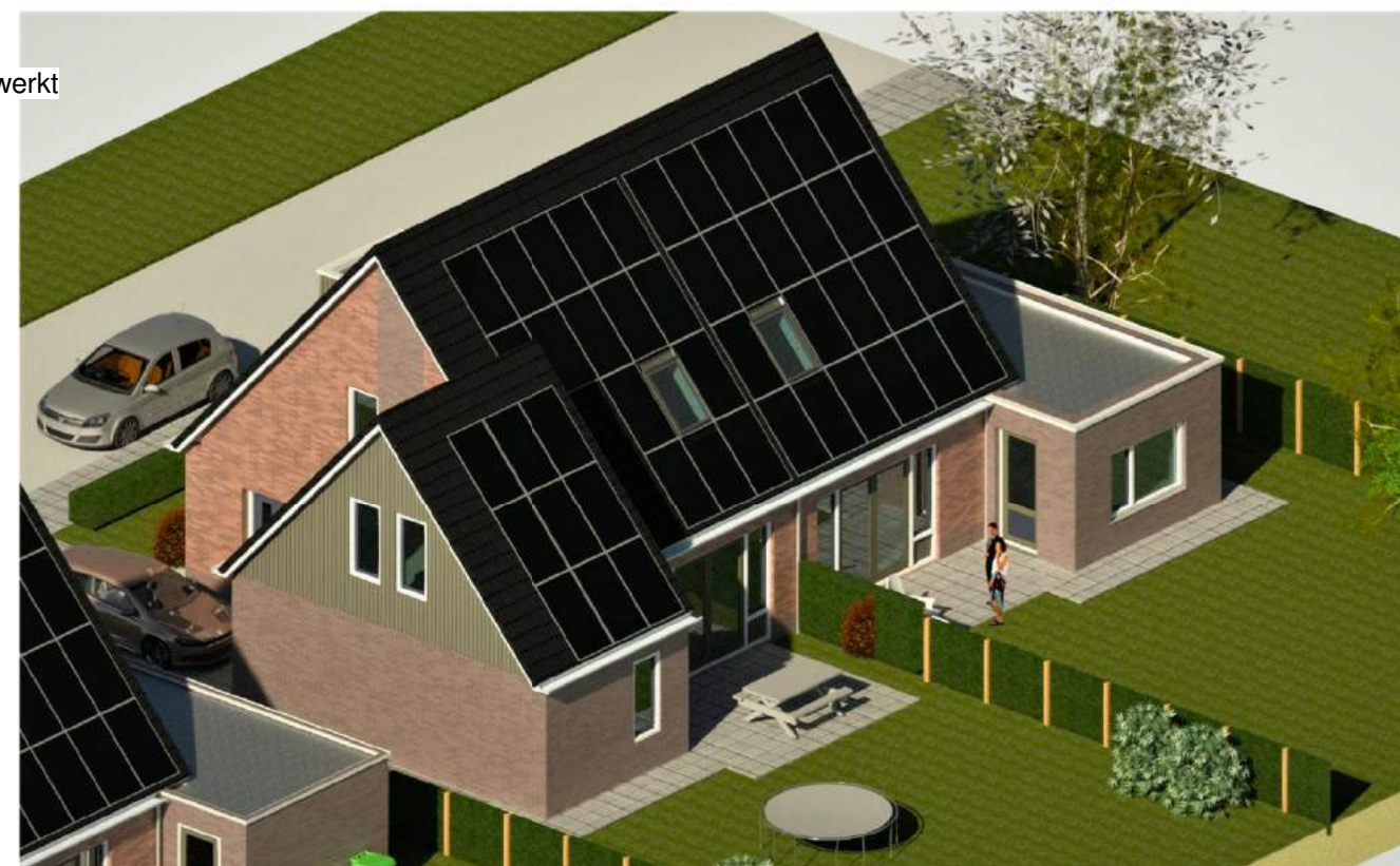
vogelvlucht aanzicht vanuit zuid.