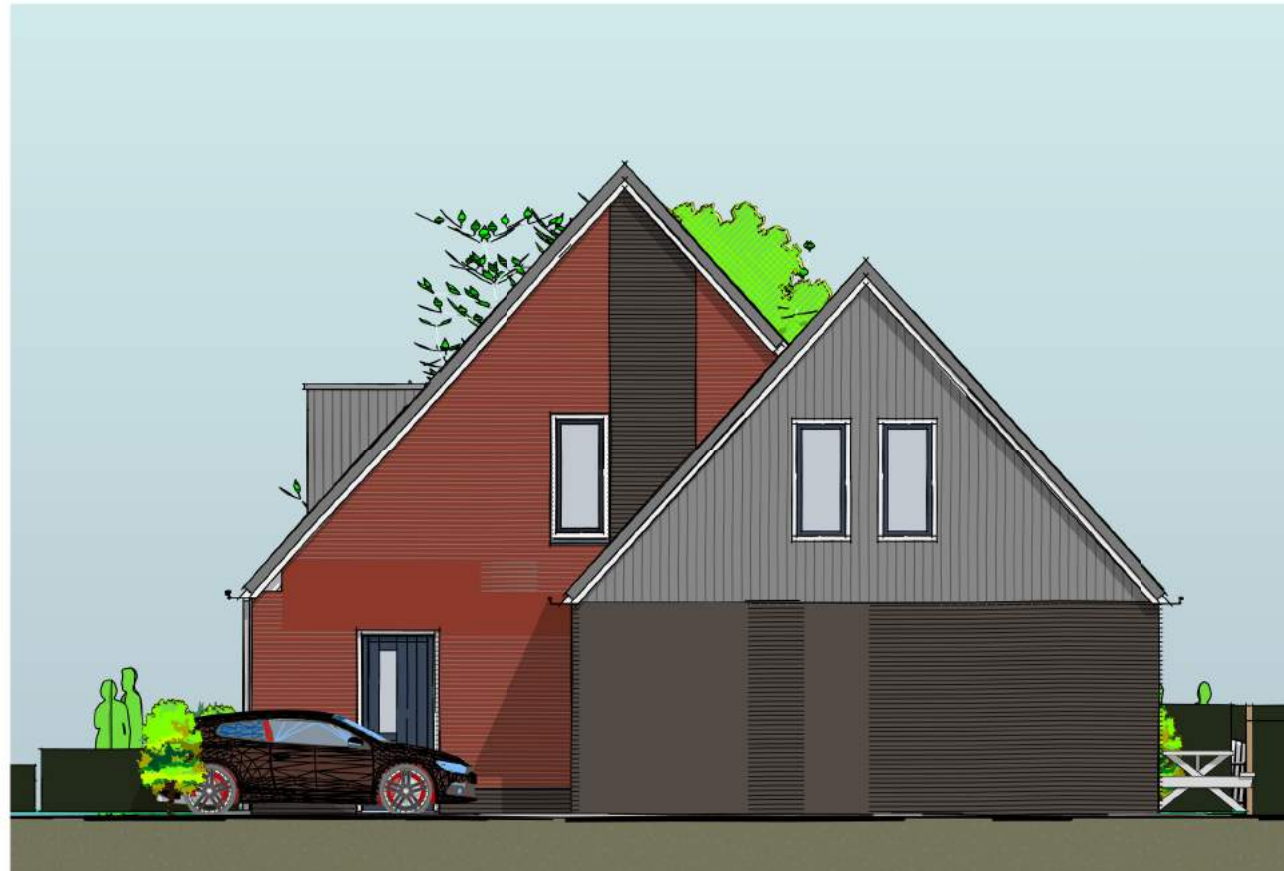
zijgevel, met optie dakkapel en kap garage.